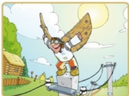
Не лезь на опоры и столбы

Чтобы не подвергать себя риску, запомните простые правила: