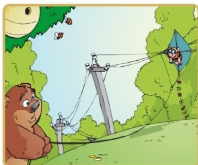
Не бросай ничего на провода и не играй вблизи

Никогда не заходите на территорию и в помещения электросетевых сооружений. Не открывайте двери ограждения электроустановок и не проникайте за ограждения и барьеры. Это может привести к печальным последствиям